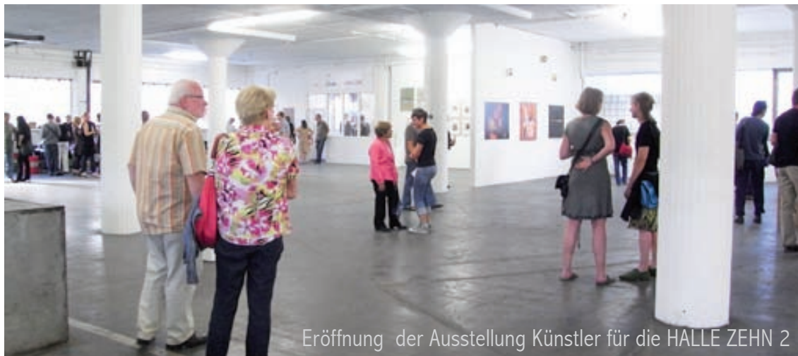
Eröffnung der Ausstellung Künstler für die HALLE ZEHN 2

Die HALLE ZEHN ist ein 1.400 qm großer Ausstellungsraum auf dem Gelände der ehemaligen Clouth-Werke in Köln-Nippes, der seit 2008 von den Künstlern des CAP Cologne e.V. als selbstverwaltetes regionales und internationales Künstlerforum betrieben wird. Die ehemalige Versandhalle der Clouth-Gummiwerke wurde in Eigeninitiative der Künstler mit Unterstützung der Stadt Köln für den Ausstellungsbetrieb umgebaut. Innerhalb kurzer Zeit hat sich das Projekt in der signifikanten Industriearchitektur als Kunstadresse etabliert, eine Reihe beachteter Ausstellungen, internationale thematische Projekte und die Besucherzahlen belegen dies. Auch deswegen hat sich der Rat der Stadt Köln im letzten Jahr offiziell für den Erhalt der HALLE ZEHN im Zuge der Umstrukturierung des Clouth-Geländes ausgesprochen. Durch die Abrissvorhaben des Kölner Liegenschaftsamtes auf den angrenzenden Flächen ist die HALLE ZEHN jetzt aber akut gefährdet, weil Sie für drei Jahre geschlossen werden soll.